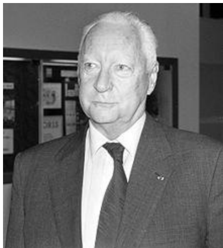
Pierre Messmer (1916 – 2007)

concentrer sur l'action opérationnelle entreprise » sans pour autant soustraire l'armée aux tâches de pacification qu'on lui avait attribuées et qui, naturellement, entraînent , nolens volens , des options politiques.