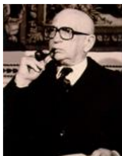
Edgard Faure (1908-1988)