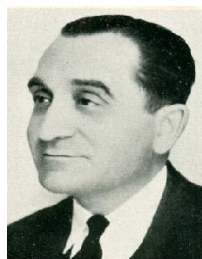
Pierre Mendès-France (1907-1982)

Sur le plan national, de Gaulle a joué, jusqu'ici, d'une opposition complaisante qui, malgré les apparences, a accepté son retour au pouvoir en nourrissant le secret espoir que le général réglerait le problème algérien par un abandon que, MENDES-France, Edgard FAURE ou Guy MOLLET au pouvoir, elle n'a pas osé. L'Elysée met d'ailleurs régulièrement les leaders de l'opposition socialiste et radicale socialiste au courant de ses projets et de ses efforts en faveur d'une solution politique négociée.