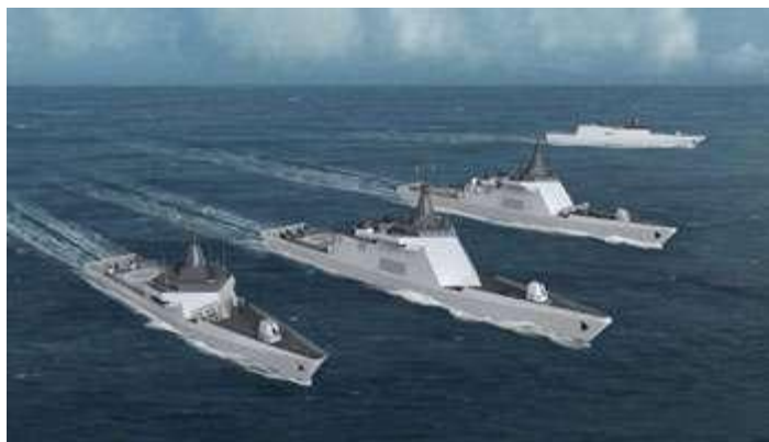
[Des corvettes de type Gowind. ]

http://www.jeuneafrique.com/Article/ARTJAWEB20140604115805/diplomatie-armement-armee-egyptienne-laurent-fabius-france-gypte-armement-l-gypte-de-sissi-offre-a-la-france-un-contrat-d-un-milliard-d-euros.html