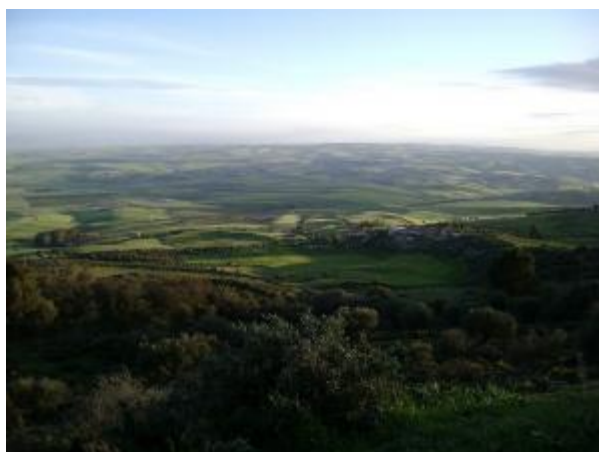
Vue du Tessala

Le village situé dans les contreforts du Tessala est dominé par le Djebel TOUIL (824 m).