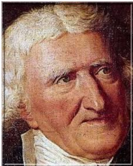
PARMENTIER Antoine (1737 – 1813)

En hommage à l'illustre savant notre localité a pris le nom de PARMENTIER. Qui était-il ?