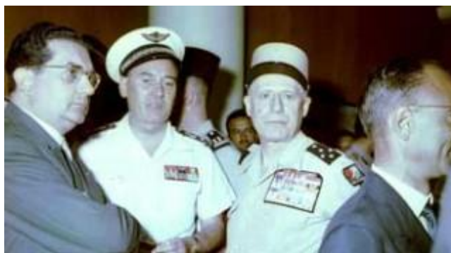
Jacques Soustelle (à gauche) – Edmond Jouhaud (Centre) – Raoul Salan (à droite)

le gouvernement de la 5 ème République n'ayant pas cherché, plus que ces prédécesseurs, à la passionner pour une Algérie indissolublement liée à la France, elle n'a pas beaucoup bougé ! Bien que l'insurrection ait été dénoncée comme une entreprise fasciste, les syndicats n'organiseront qu'une grève, symbolique, d'une heure, pour le 2 février : une récréation !