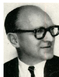
Guy Mollet (1905-1975)

Mais l'opposition avec le temps qui passe, voit se fortifier un pouvoir, présidentiel de toute évidence, où l'influence des partis s'amenuisera. Pour écourter le règne du général, il faut donc hâter le dénouement de l'affaire algérienne. Et l'opposition de réclamer à cor et à cri, avec l'accentuation du virage politique, la mise au pas « des amis, des artisans, des complices de ceux qui déclenchèrent la révolte algéroise ».