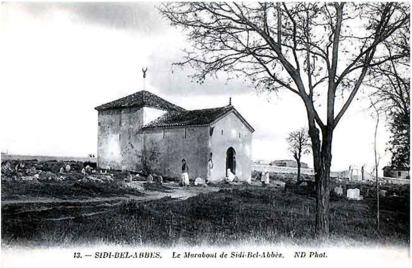
13. — SIDI-BEL-ABBES, Le Marabout de Sidi-Bel-Abbès.

Cette haute plaine de SIDI BEL ABBES, moins élevée que celle de TLEMCEN ne fut cependant colonisée qu'un peu plus tard. La banlieue de BEL ABBES fut peuplée en 1849, puis successivement PRUDON et SIDI l'HASSEN en 1856, TENIRA en 1858, LES TREMBLES et SIDI KALED en 1863, LAMORICIERE en 1869, CHANZY en 1870, DELIGNY en 1872, MERCIER LACOMBE en 1874 et enfin PARMENTIER en 1875.